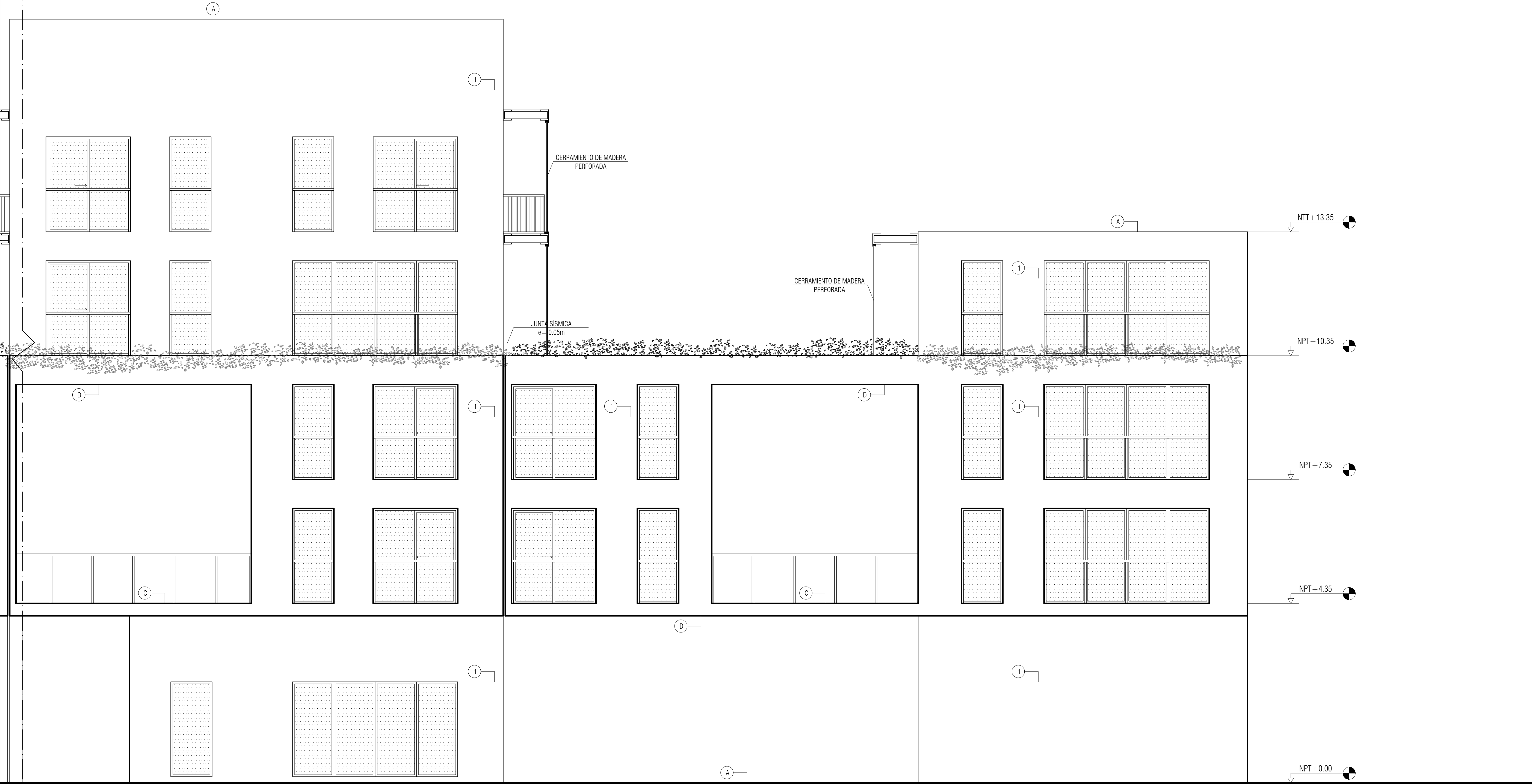
ELEVACIÓN NORTE ESCALA 1/50